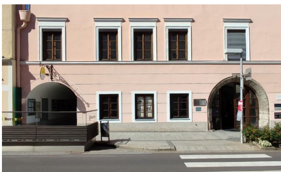
Büro 1.OG Straßenansicht