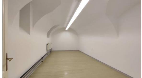
Geschäft Raum 3