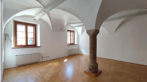
Geschäft Raum 1