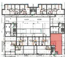
EG - M 1:1000