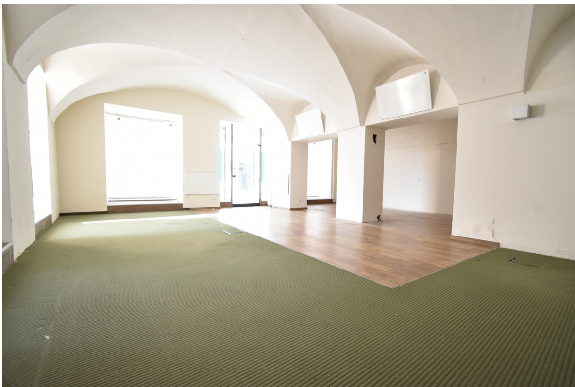
Büro-, Geschäfts oder Ausstellungsraum