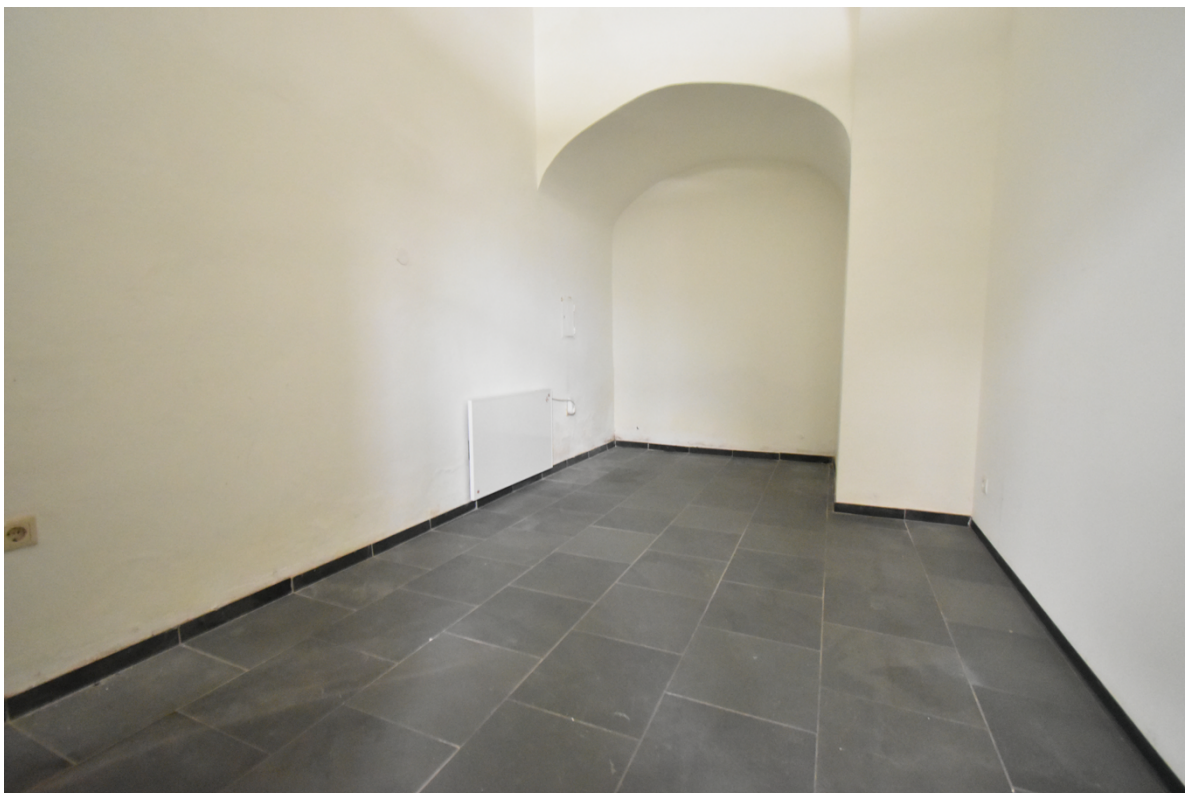
Büro-, Geschäfts oder Ausstellungsraum