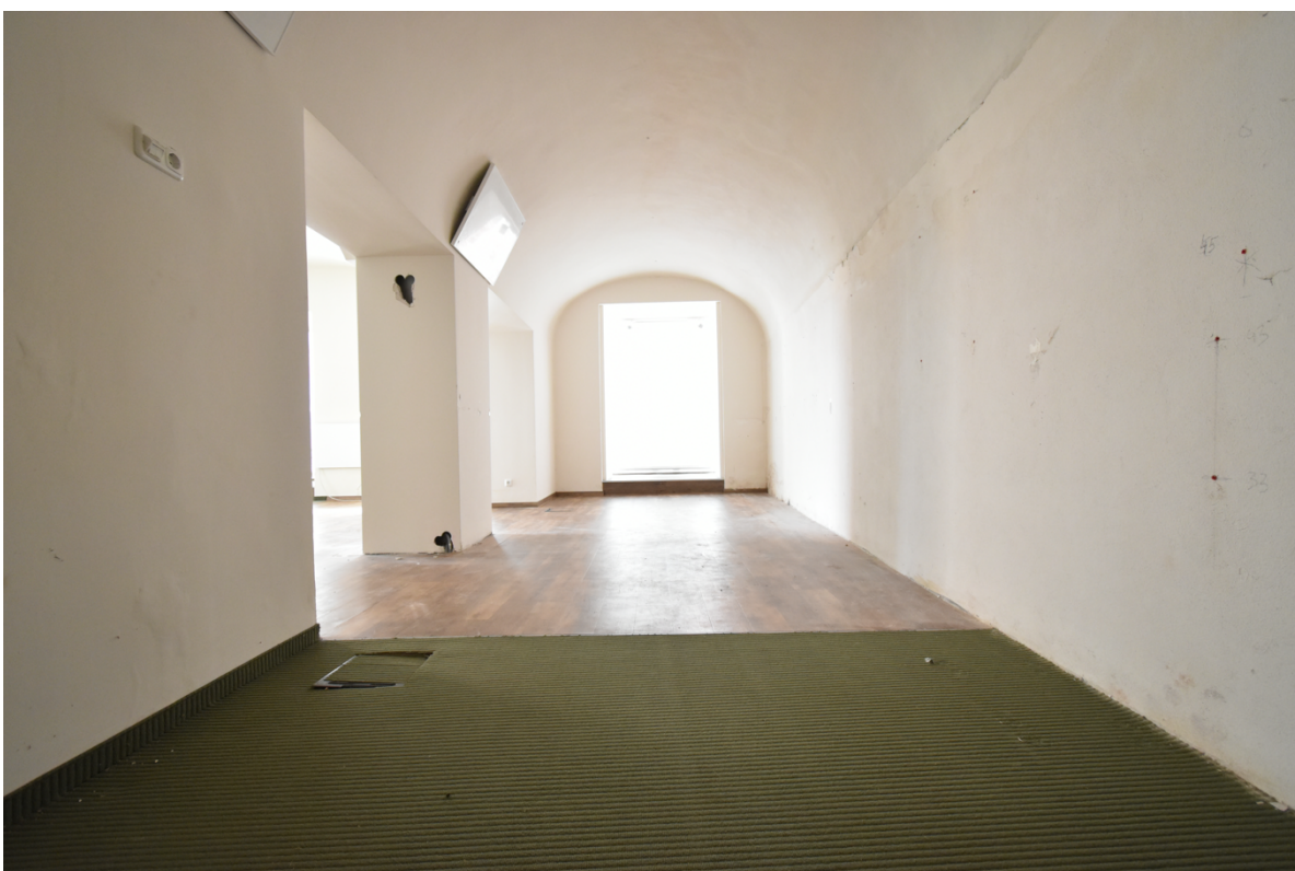
Büro-, Geschäfts oder Ausstellungsraum