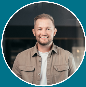
Stefan Artmayr Vermittlung

Linzer Straße 26 A-4701 Bad Schallerbach