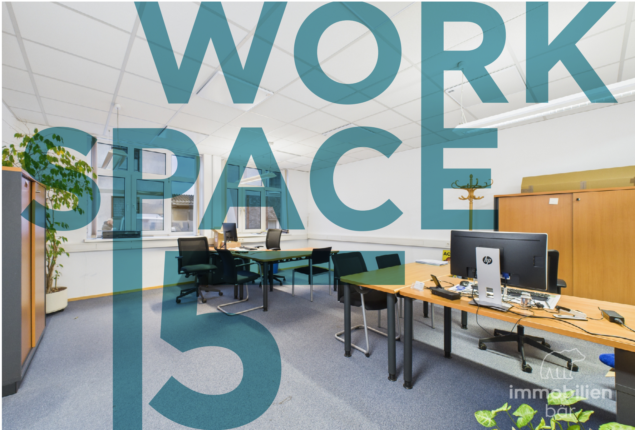
Oberer Stadtplatz 15 - 4710 Grieskirchen