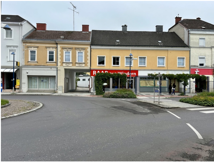
Straßenfront am Kreisverkehr