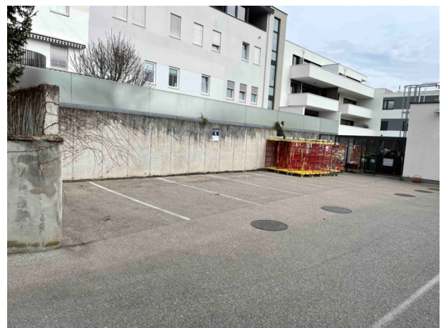
6 Innenhof-Parkplätze (4 dzt. noch verfügbar)