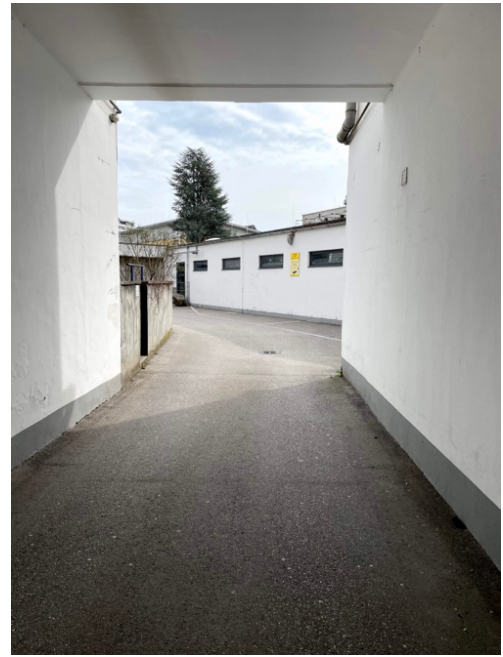
Einfahrt zum Innenhof