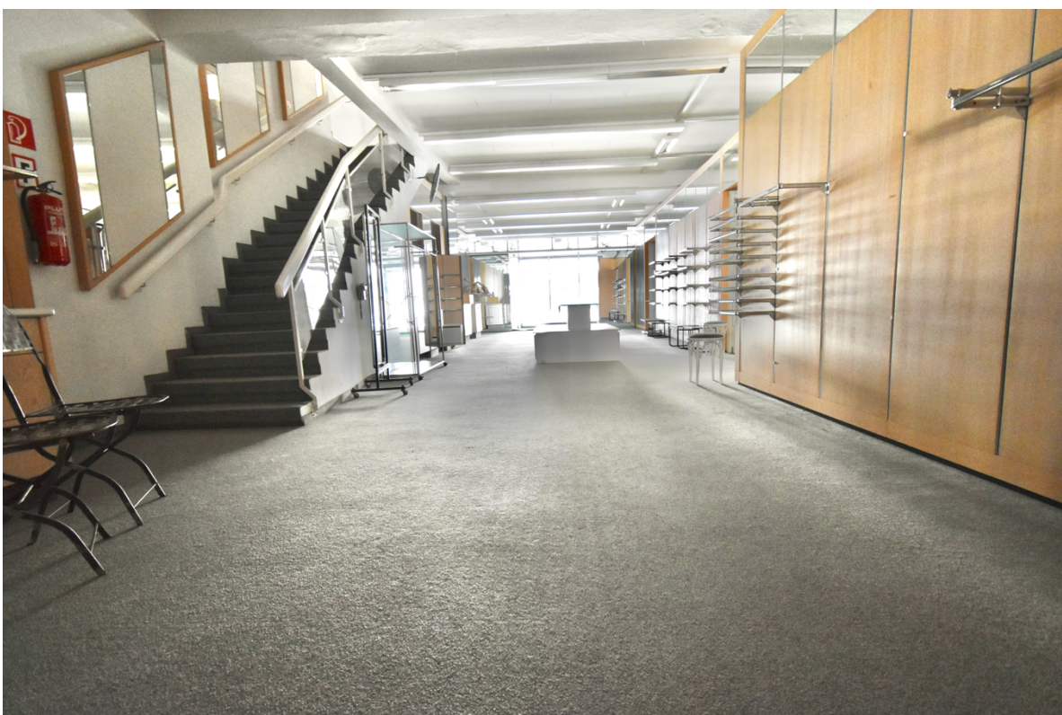
Büro-, Geschäfts oder Ausstellungsraum