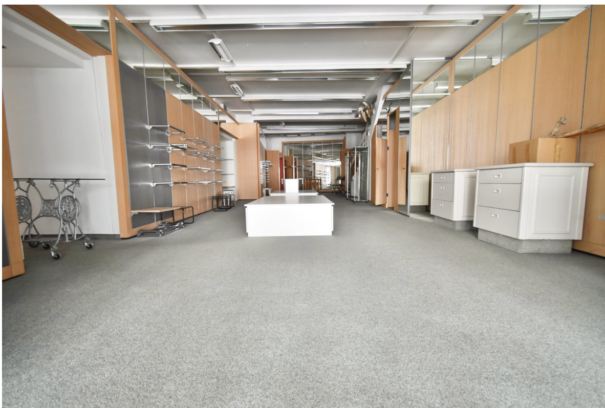
Büro-, Geschäfts oder Ausstellungsraum